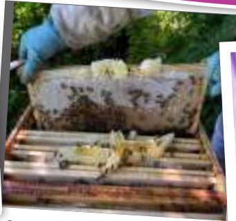
Les produits de la ruche