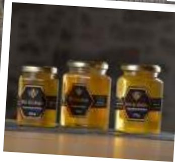
Goûter et dégustation