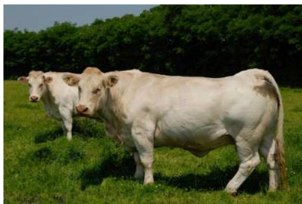
Réformes charolaise dans un paddock

Les expérimentations menées par le CIVAM proposent de mettre à disposition 30 ares par UGB et de diviser la surface totale en 4 ou 6 pour ne rester que 10 jours maximum par paddock. Il sera au repos entre 30 et 50 jours. L'herbe trop haute sera fauchée et le paddock sauté.