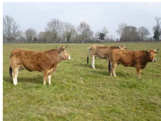
Réformes parthenaises à l'engraissement

De plus en plus employée dans l'Ouest de la France, cette technique est encore peu répandue dans nos territoires. Elle pourrait cependant être employée dans des fermes qui utilisent moins de surface, et où le potentiel agronomique des sols est important (sols profonds, bonne pluviométrie). Ces techniques vont demander plus de travail et de surveillance pour l'éleveur que le système extensif, mais il reste relativement moindre qu'un engraissement traditionnel à l'auge. Cette technique va optimiser les valeurs de l'herbe et son assimilation. Des races moins rustiques pourront aussi être conduites de la sorte. Le CIVAM du Haut Bocage réalise des expérimentations sur ce thème que nous présenterons ici.