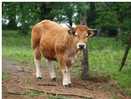
Génisse de 2 ans (doublonne) prête pour l'abattage

Roland Carrié est éleveur de bovins allaitants de race Aubrac en bio dans le Nord de l'Aveyron sur la commune de Vitrac en Viadenne. Il exploite 120 ha de prairie permanente avec un troupeau de 75 mères. Malgré les hivers rigoureux, cet éleveur arrive à limiter ses achats en céréales. « A 1 100 m d'altitude, il est difficile de produire autre chose que de l'herbe ».