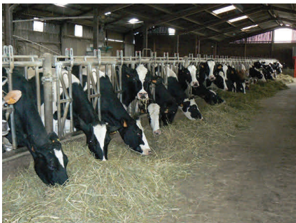
Les Prim'Holsteins du GAEC de l'Odysée ( www.primholstein.fr/aveyron )

Parmi 74 agriculteurs du GIE, une ferme est en bio depuis 2011 . Le GAEC de l'Odysée produit 280 000 L de lait de vache pour Biolait, par l'intermédiaire du GIE. La collecte de leur lait n'a pour l'instant aucun risque d'être arrêtée, néanmoins le GAEC est intéressée pour participer au projet du groupement en produisant un fromage de terroir biologique .